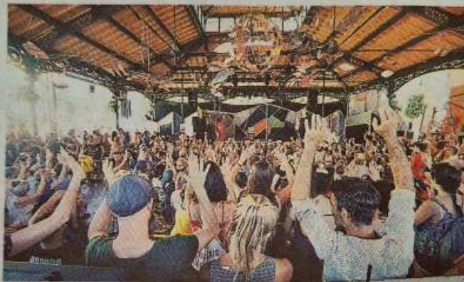
Plonger au cœur de l'événement et rencontrer les artistes autrement

S'il faut encore faire preuve de patience pour en connaître la programmation complète, MIMA promet, d'ores et déjà, une édition puissante et percutante avec, pour le In : 23