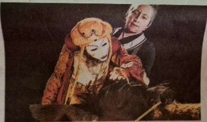
D'après le conte Peau d'Âne.

L'histoire de ce spectacle : avoir un bon copain, c'est ce qu'il y a de meilleur au monde... Mais