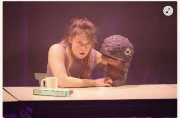
Foetus Project - Cie Les Enfants de Ta Mère

Plus sur le thème : Festival de l'été 2025