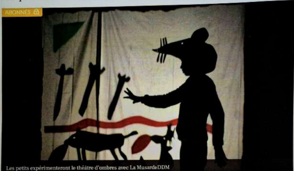
Les petits expérimenteront le théâtre d'ombres avec La MusardeDDM