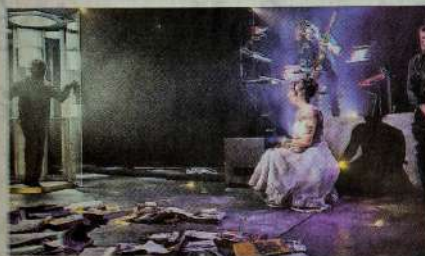
Des interprétations justes et émouvantes