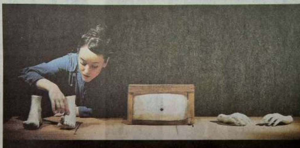
La pièce Entrañas sera aussi proposée le 27 novembre à 19 heures à la salle des fêtes d'Esperaza. / Mima.

Ce spectacle bouleversant, à la fois sensible et puissant, qui entremêle théâtre d'objets et récit