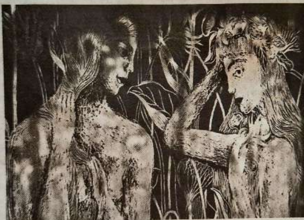
Une scénographie conçue comme une expo à partir d'images de Sophie Lécuyer.

Dans Humble Humus , qui raconte l'histoire d'amour d'une femme et d'une montagne, un homme chute et meurt sur le Mont Lozère. Lentement, ce corps aimé d'une femme se transforme en humus. En cherchant où remettre à la montagne cet amour devenu humus, le rapport de la femme à la montagne passe de connu à apprécié, puis aimé. Ces métamorphoses multiples prennent la forme d'une exposition vivante faite de théâtre d'ombres, d'invitation à déambuler dans la montagne, convoquée dans le théâtre, et révèlent la mul-