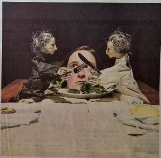
La marionnette actuelle est à découvrir ce week-end en Ariège.