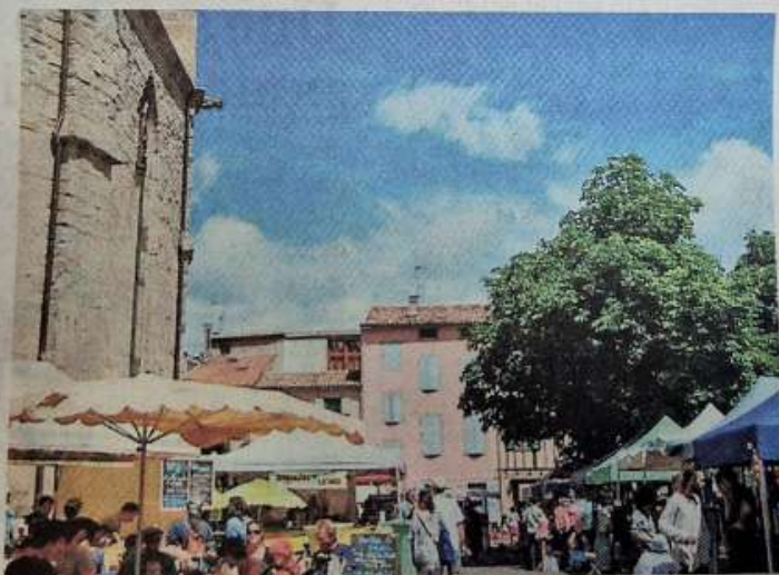
Le marché des créateurs à Mirepoix.