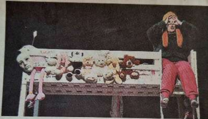
Le problème quand tu dors, c'est que le temps continue de s'écouler.

Chaque nuit, à l'heure où tout le monde s'endort, Thalia garde ses paupières grandes ouvertes. Elle profite de ce moment pour se débrancher du quotidien et ouvrir la porte « des mondes englou-