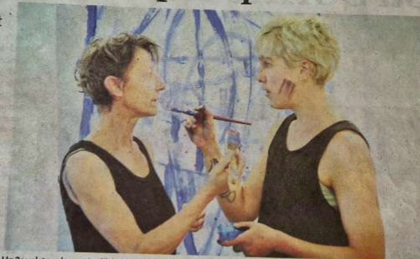
Un 2e volet sur la santé et l'hôpital public.

Dans un espace inspiré par l'art brut et sans cesse transfiguré