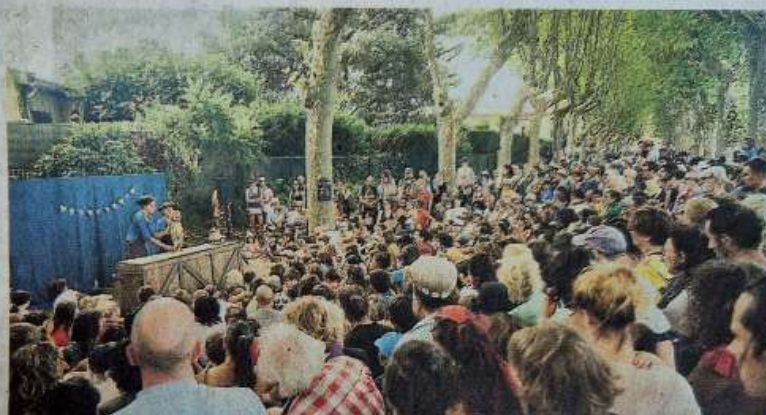
Chaque année sur le Off, le théâtre de plein air affiche complet.

L'objectif du collectif, formé principalement d'artistes, de techniciens et de passionnés de la marionnette, tous bénévoles, reste l'envie de soutenir cet espace de création, d'air, de liberté et de rencontre qui les motive chaque année à poursuivre cette aventure en l'améliorant. Cet été 2025 marque un tournant pour les bénévoles du collectif avec la création de l'association MIMA Off, afin de continuer à œuvrer du mieux possible pour accueillir compagnies et publics pendant 4 jours. Sur le plan économique, le collectif est parti de rien et avance sans subventions grâce aux recettes générées par le Bar'Ouf et la vente des programmes, affiches et/ou autres créations liées au Off de MIMA. Cette année encore, les candidatures de compagnies françaises et du monde entier ont été nombreuses pour postuler dans le Off. Parmi les 130 dossiers re-