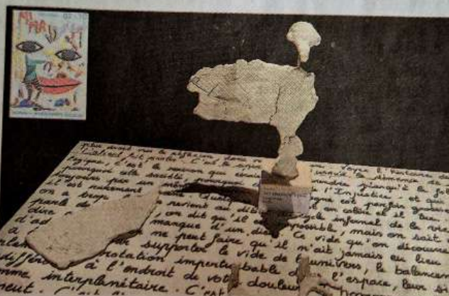
Expo basée sur les témoignages et sculptures des patientes.