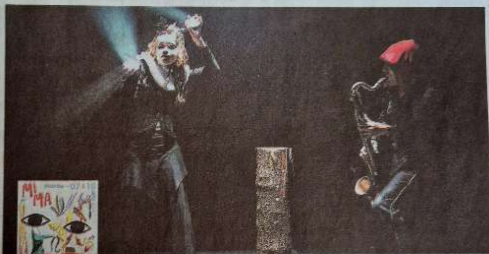
La Manéchine, histoire initiatique féminine, lumineuse et sanglante.