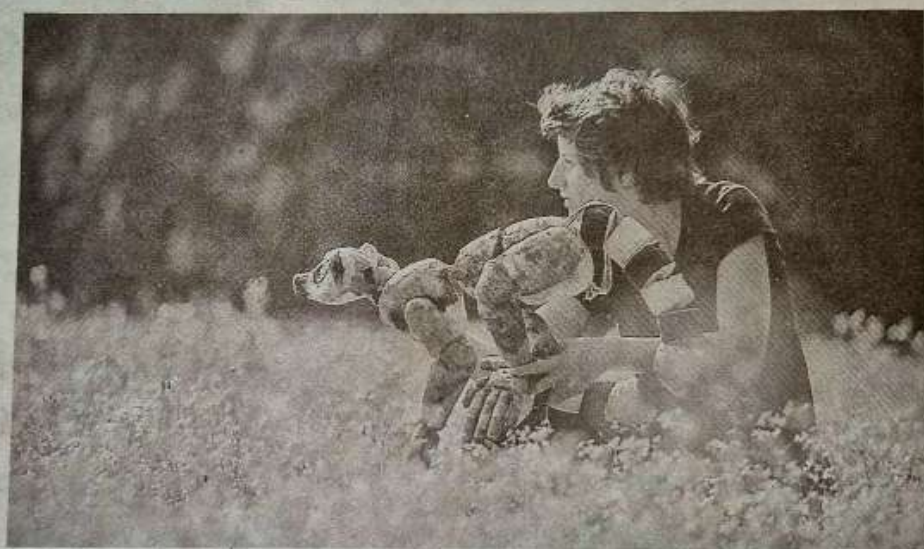
4e rendez-vous de la création avec la Cie Traversant 3/Photo S. Bignon

À travers cette fable environnementale et sociale, la compagnie Pélélé souhaite parler de la sobriété qui devrait porter nos relations, au monde et aux autres. nous amenant à cheminer sur la tempérance de nos attitudes et l'appréciation de nos besoins. Un message fort, porté par toute la sagesse du récit traditionnel africain comme miroir de notre société contemporaine. Parallèlement, c'est à Dun que la compagnie Traversant 3 s'installera, du 10 au 21 février, pour