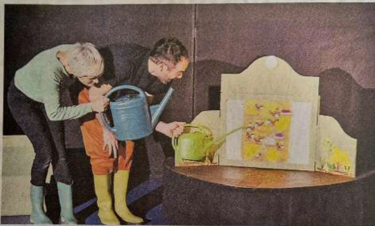
Théâtre de papier et musique pour philosopher avec les enfants autour du potager de Pomelo.

Réservation pour le spectacle et inscription à l'atelier : mediatheque@paysdemirepoix.fr