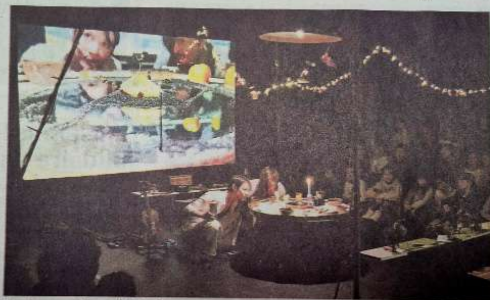
Sous Terre , coup de cœur du festival MIMA 2023.

Inspiré de sources documentaires, Sous Terre est une exploration du monde souterrain dans une forme hybride mêlant arts plastiques, théâtre d'objets, musique et vidéo.