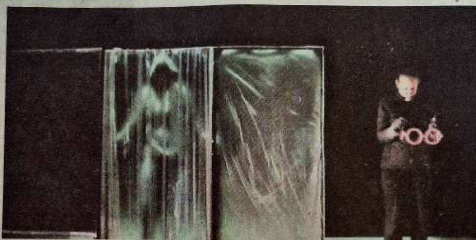
La marionnette permet de rendre visible l'invisible et de dire l'indicible

Elle a animé des temps de parole et de débats avec un groupe d'élèves « ambassadeurs » anti-harcèlement et proposé son spectacle-action Habiles Solidarités, forme légère et interactive in situ invitant les adolescents à une expérience ludique et poético-scientifique, de la cour à la salle de classe.