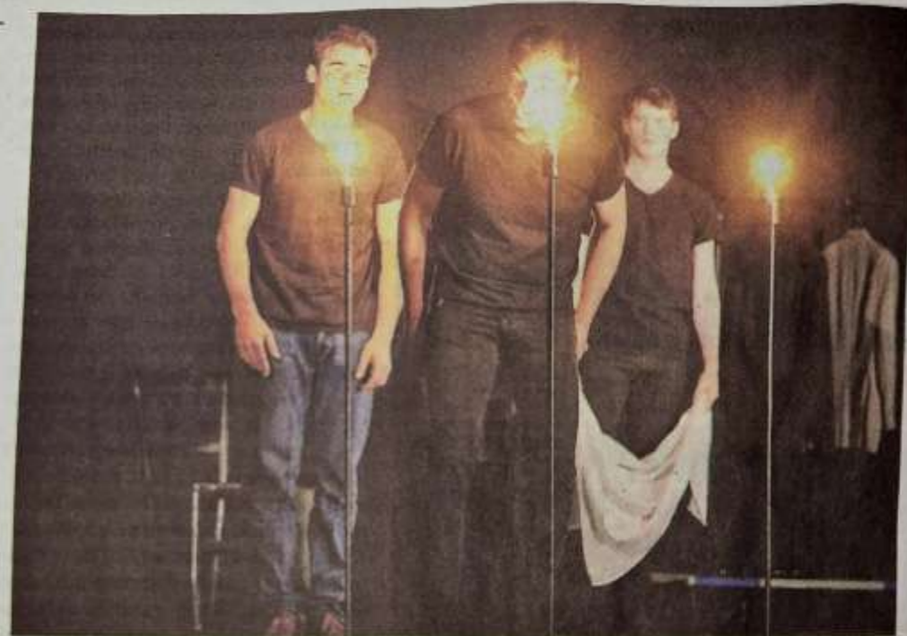
Vacarme(s), un hymne au monde rural.

Vacarme(s), c'est d'abord l'histoire d'une ferme : celle des Drailles, quelque part sur le Causse où vit et travaille, depuis des générations, la famille Gayart. C'est aussi l'histoire de Pierre, un paysan que l'on retrouve à différents âges et virages de sa vie, du petit garçon parfois honteux de ses origines au jeune père fier et plein d'espoir. Le spectacle nous entraîne à l'aube