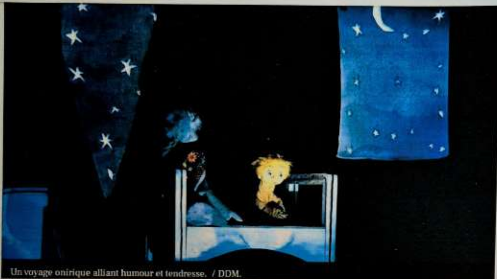
Un voyage onirique alliant humour et tendresse.