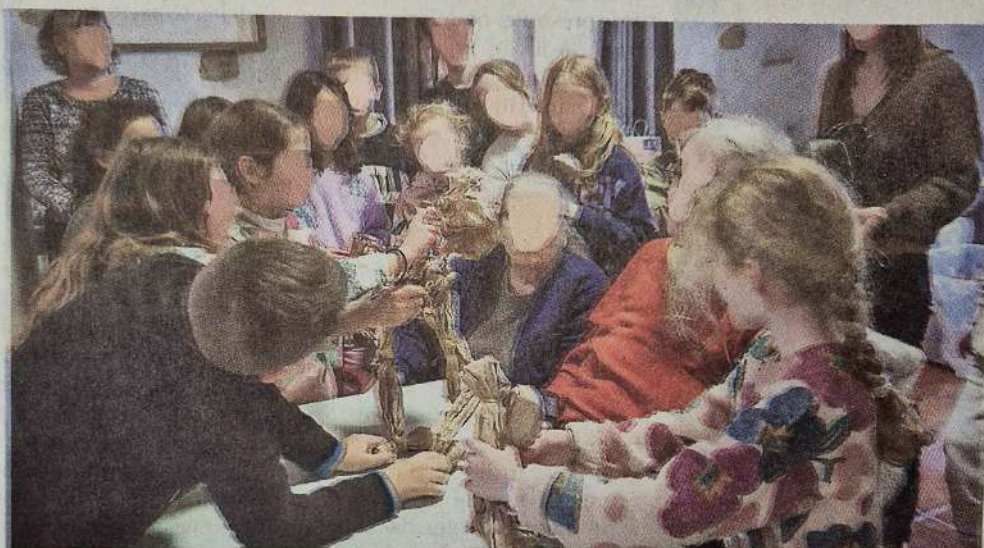
Atelier à l'EHPAD avec le collectif Super Baobab, en 2025/Mima.

L'un des projets phares, appelé « Bamboche », sera lancé en décembre 2025 pour deux ans, en coopération avec la DRAC. Mené par la Rift Compagnie, il vise à accompagner artistiquement les résidents et le personnel de l'EHPAD de Mirepoix dans l'anticipation de leur déménagement en 2027. Ce projet intergénérationnel collectera et mixera les souvenirs de fêtes et les chansons préférées des