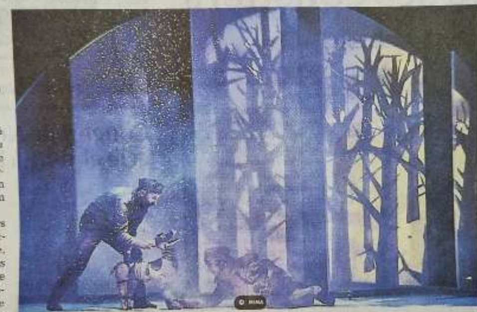
Une jolie histoire avec une Laïka attachante et aussi vraie que nature/Mima

Un spectacle visuel et immersif inspiré de faits réels