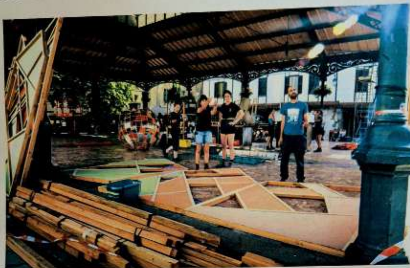
La scénographie contribue à l'identité artistique de MIMA

Pour sa 37 e édition, le festival MIMA investira la cité médiévale du 7 au 10 août autour d'une programmation féminine et créative.