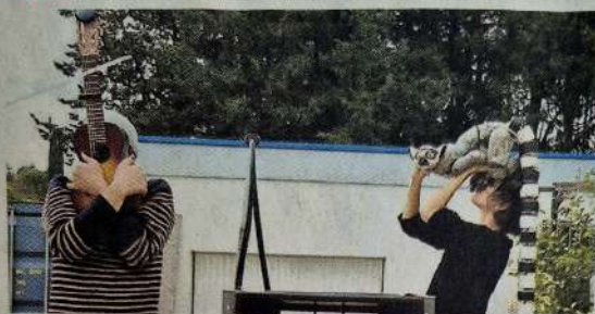
Les 4 protagonistes de « Sale Bête ».