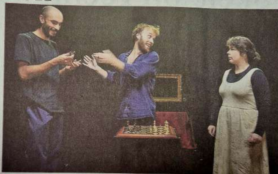
La Pièce Maîtresse sera présentée vendredi à Mirepoix. / Compagnie Tac Tac.

Dans ce spectacle, la compagnie met en scène des personnages constamment pris par la peur de l'insuccès ou hantés par des souvenirs de défaites, chacun tentant de trouver sa place en fonction de son genre, de ses savoir-faire et de son caractère.